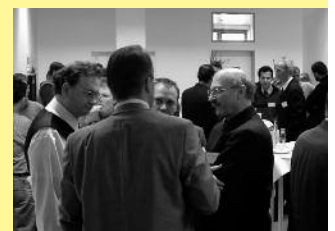
Säule 4: Kontaktbörse