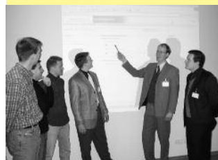
Säule 1: Fachvorträge