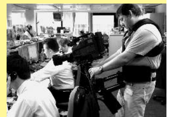
Säule 2: Praxisdemonstration