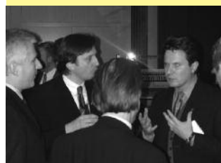
Säule 3: Fachdiskussion